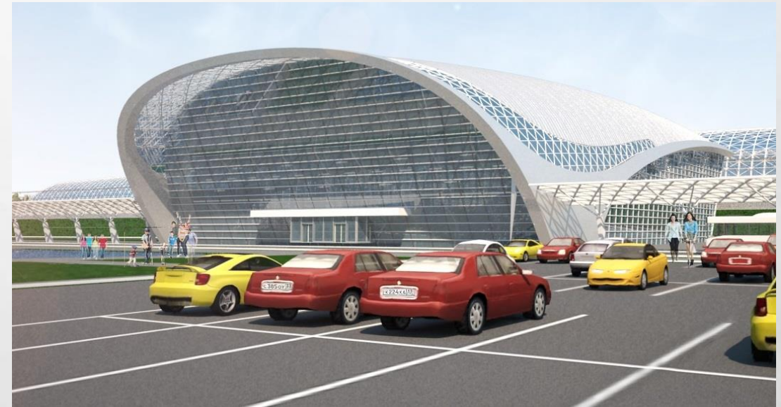
Терминальный комплекс железнодорожной магистрали «Москва – Казань – Екатеринбург»