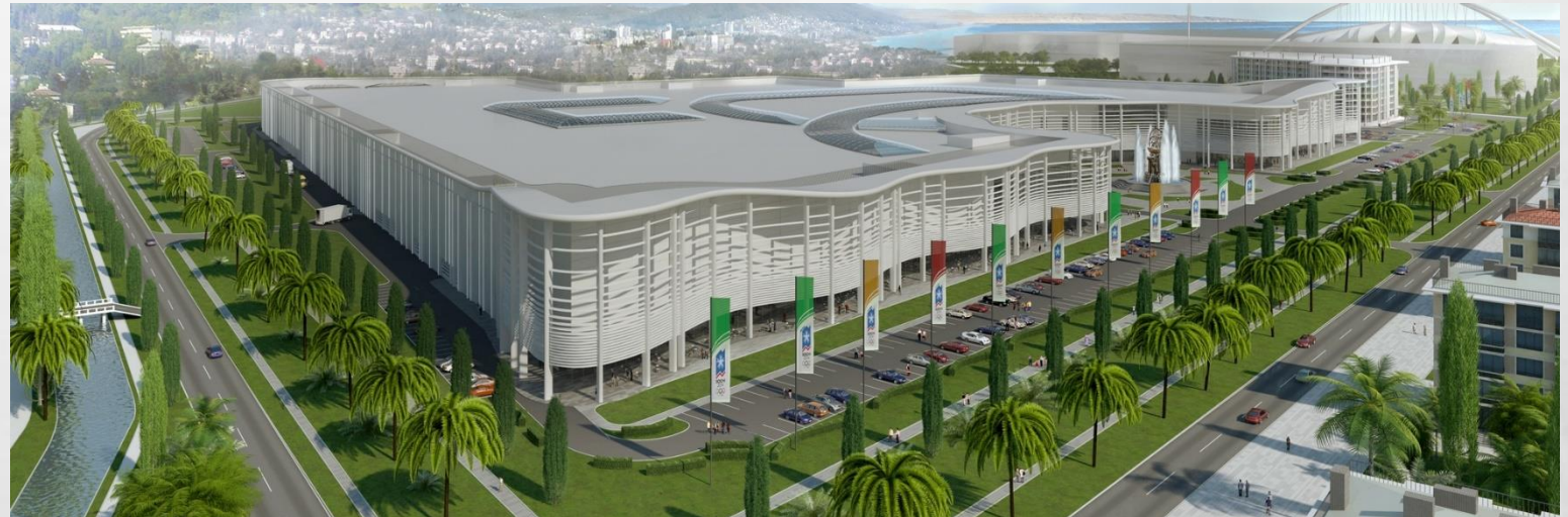
Главный Медиа Центр, г. Сочи, Олимпийский проспект, 1