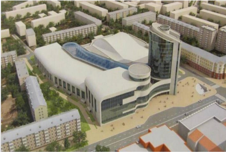
Спортивный комплекс «Дворец спорта» г. Калуга