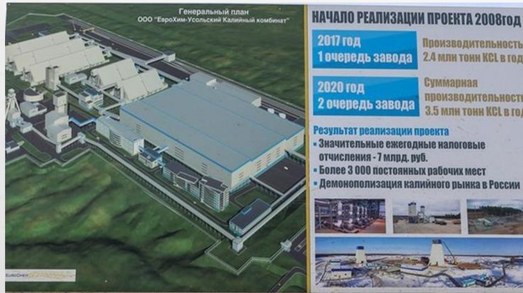
Горнодобывающий комплекс Усольского калийного комбината