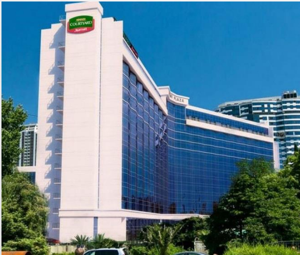
Трехзвездочный гостиничный комплекс «Сочи-Плаза» г. Сочи, Центральный район, Курортный проспект, 18