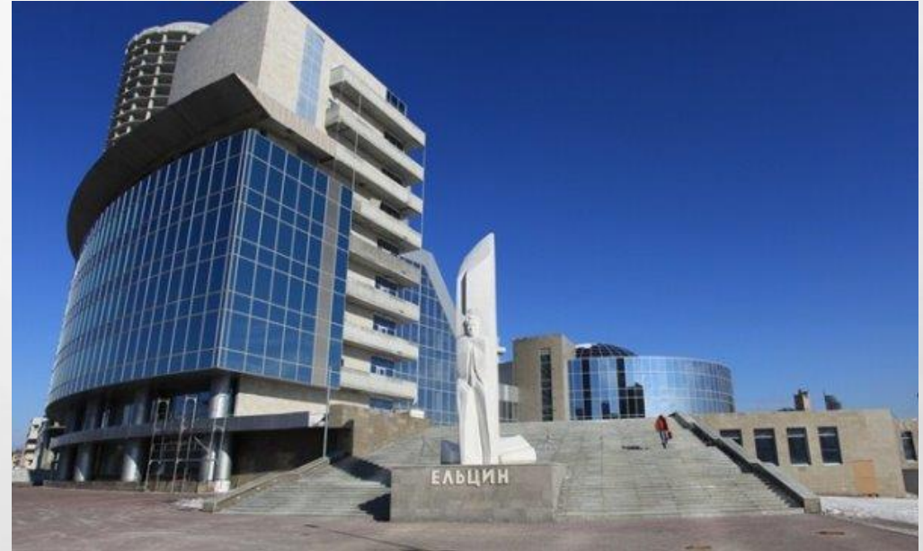
«Многофункциональный комплекс с конгресс-холлом» по адресу: г. Екатеринбург, ул. Бориса Ельцина, 3 под размещение «Президентского центра Б.Н. Ельцина».