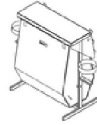
Рис. 2 Стенд поворотный с бункером для песка на 0,2м 3